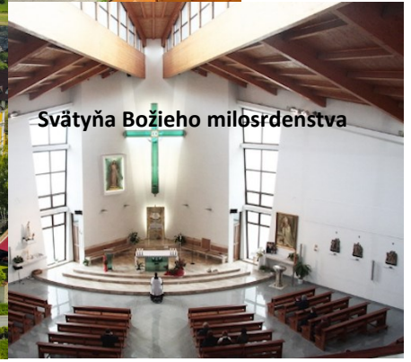
Svätýňa Božieho milosrdenstva